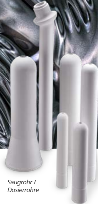
Saugrohr / Dosierrohre