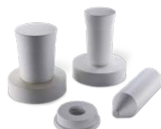
Stopfen / Platten