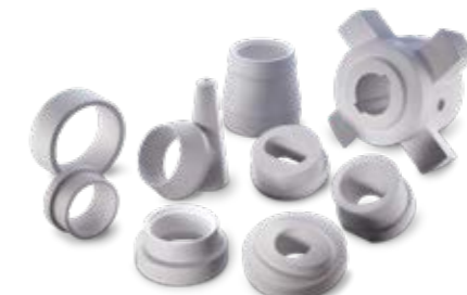
Düsen / Buchsen